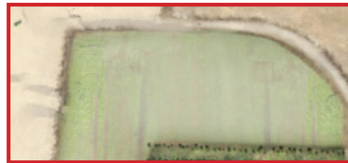
Remise en état agricole