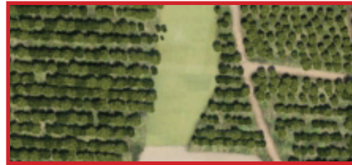
Plantations herbacées et arbustives