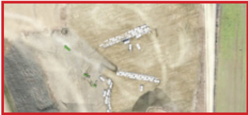
ISDND - Déchets de matériaux de construction contenant de l'amiante