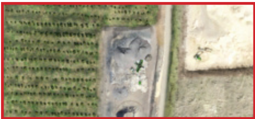
Plateforme de recyclage des bétons de déconstruction