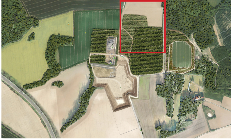
7 : ZONE DE REAMENAGEMENT DE TERRAIN AGRICOLE Reprofilage pour aménagement paysager du secteur nord du site